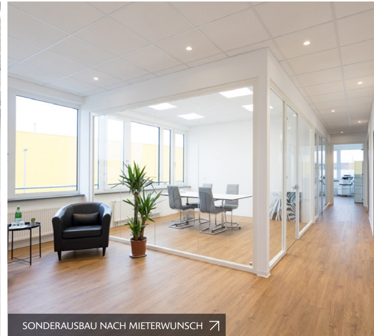
SONDERAUSBAU NACH MIETERWUNSCH ↗