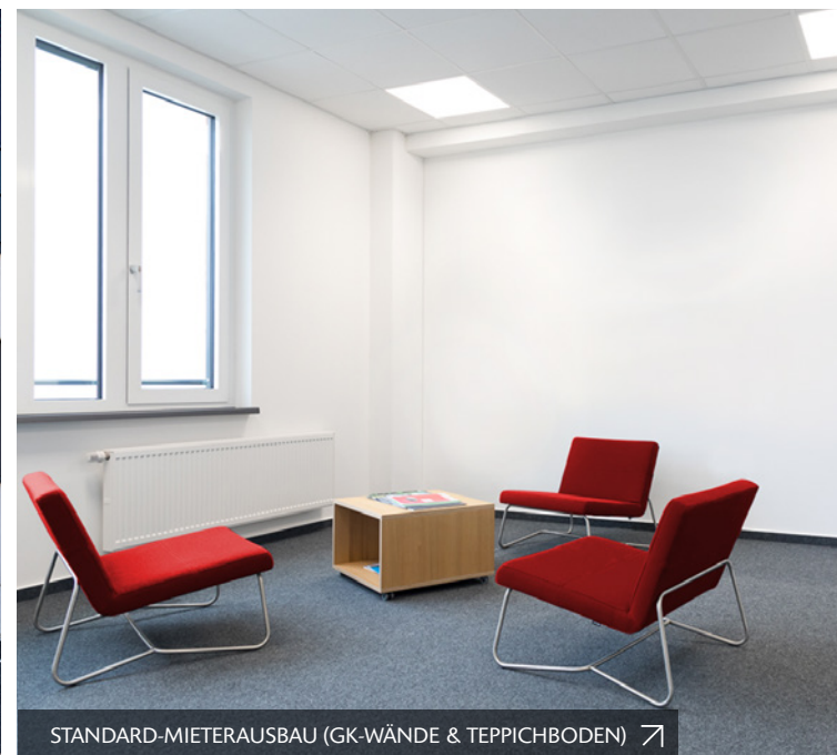
STANDARD-MIETERAUSBAU (GK-WÄNDE & TEPPICHBODEN) ↗